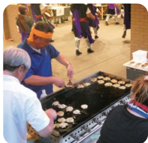
職員も総出で夜店の準備。皆様に好評の「うどん餃子」！永寿園とよなかの名物になりそうな予感です。来年もお楽しみに。