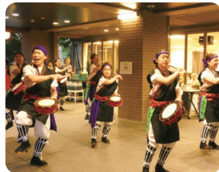
掛け声の迫力に躍動感もあり皆様楽しんでおられます。

8月9日(金)永寿園とよなか夏祭りが開催されました。やあにんじゅ太鼓の皆様が創作エイサーを披露して下さいます。毎年大好評で皆様真剣に見入っております。