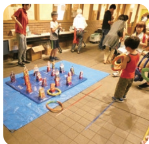
輪投げは小さなお子様からお年寄りまで皆さん楽しんで参加して下さいました。