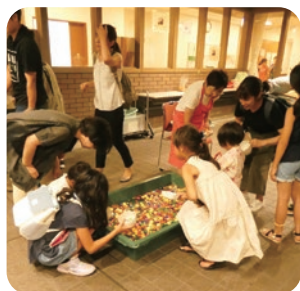
スーパーボールは、子供たちに大人気。色々な形のあるので真剣に選びながら、いつの間にか夢中になってされていました。

8月9日(金)永寿園とよなか夏祭りが開催されました。やあにんじゅ太鼓の皆様が創作エイサーを披露して下さいます。毎年大好評で皆様真剣に見入っております。